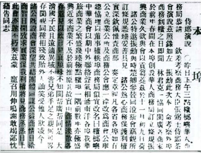
1903年檳榔嶼中華總商會創立，中國清朝商務大臣張弼士於1905年奉清廷命到檳道賀演說。