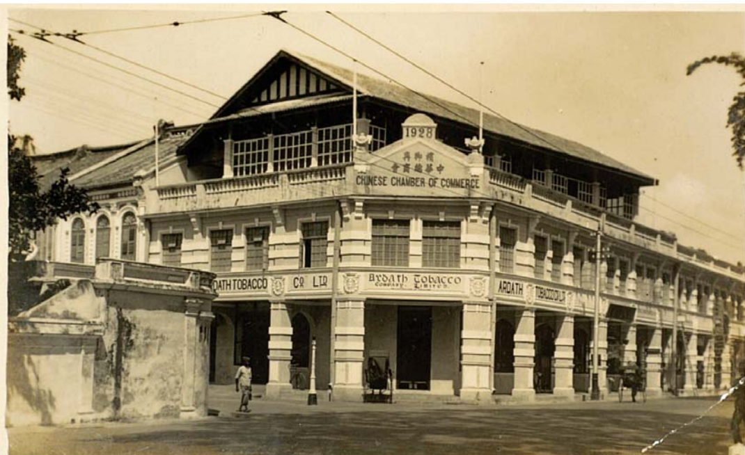
Chinese Chamber of Commerce, Penang.

1903年创办的槟榔屿中华总商会（现称槟州中华总商会），是马来西亚最早成立的民族总商会。图为槟榔屿中华总商会旧会所。